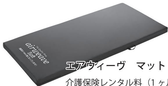
エアウィーヴ マットレス M80

良い睡眠の為に適切な疲労感も必要です。 日中にポールを使ったウォーキングで運動の習慣をつけてみるのはいかがでしょうか。