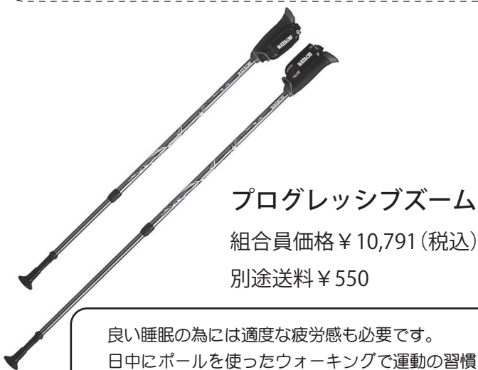
プログレッシブズーム 組員価格 ¥10,791 (税込) 別途送料 ¥550

良い睡眠の為に適切な疲労感も必要です。 日中にポールを使ったウォーキングで運動の習慣をつけてみるのはいかがでしょうか。